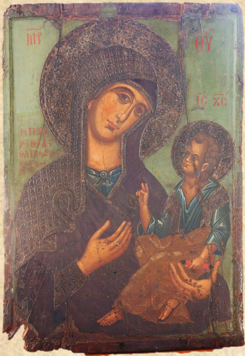
ΠΑΝΑΓΙΑ Η ΠΑΡΑΜΥΘΙΑ ΤΩΝ ΘΛΙΒΟΜΕΝΩΝ ΚΑΙ ΑΔΙΚΟΥΜΕΝΩΝ 14ος αιώνας ΠΕΝΤΑΛΙΑ, ΝΑΟΣ ΑΓΙΟΥ ΓΕΩΡΓΙΟΥ