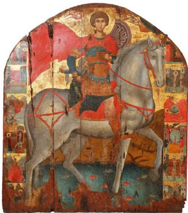
ΑΓΙΟΣ ΓΕΩΡΓΙΟΣ Ο ΠΕΡΒΟΛΙΑΤΗΣ 16ος αιώνας ΠΑΦΟΣ, ΝΑΟΣ ΑΓΙΟΥ ΚΕΝΔΕΑ

Η έννοια της παγκοσμιοποίησης είναι αντιφατική προς την ίδια την ανθρώπινη φύση. Η ιδιαιτερότητα είναι η πεμπουσία της ανθρώπινης ταυτότητας. Αν η λήθη είναι ατομικό δικαίωμα των ανθρώπων, η συλλογική μνήμη αποτελεί υποχρέωση των λαών, για να μπορούν να επιβιώνουν, να παραδειγματίζονται από τα κατορθώματα των προγόνων, να μιμούνται τις αρετές και να αποφεύγουν τα λάθη τους.