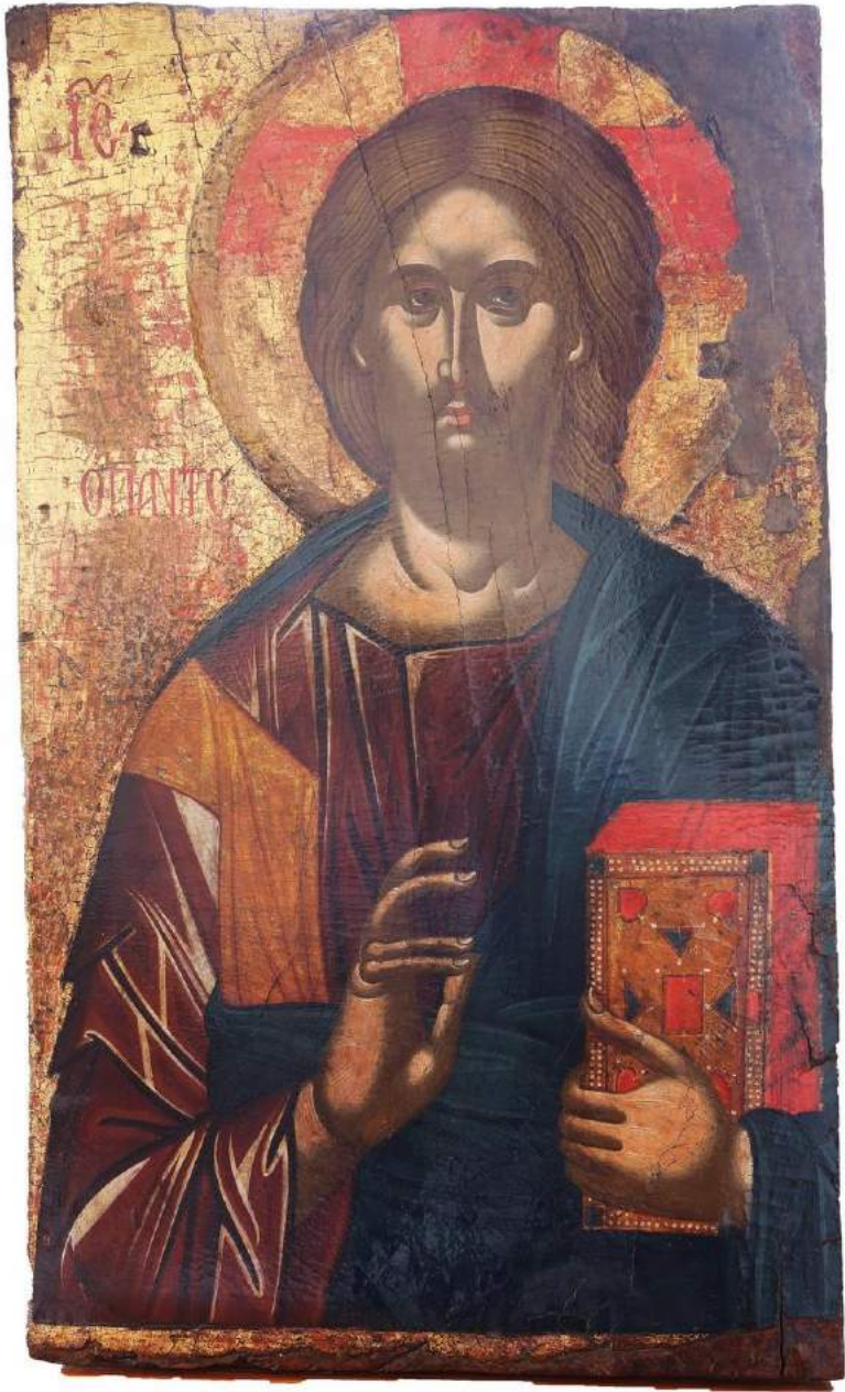
ΧΡΙΣΤΟΣ Ο ΠΑΝΤΟΚΡΑΤΩΡ 16ος αιώνας ΤΣΑΔΑ, ΝΑΟΣ ΑΓΙΩΝ ΚΩΝΣΤΑΝΤΙΝΟΥ ΚΑΙ ΕΛΕΝΗΣ