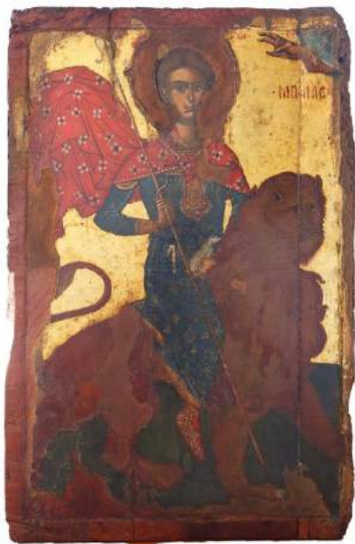
ΑΓΙΟΣ ΜΑΜΑΣ 16ος αιώνας ΚΕΔΑΡΕΣ, ΝΑΟΣ ΑΓΙΟΥ ΑΝΤΩΝΙΟΥ

Ο ρόλος ενός Μουσείου δεν εξαντλείται στην απλή φύλαξη, ούτε και στην ανάδειξη, ή στην προβολή, θησαυρών του παρελθόντος. Εκτείνεται στη διατήρηση της παράδοσής μας και στη διασύνδεση μ' αυτή. Στη δημιουργία της συναισθησης της ευθύνης μας απέναντι στους προγόνους, στους απογόνους, σ'όλο τον κόσμο· στην προβολή του πολιτισμού μας σ' όλη την οικουμένη.