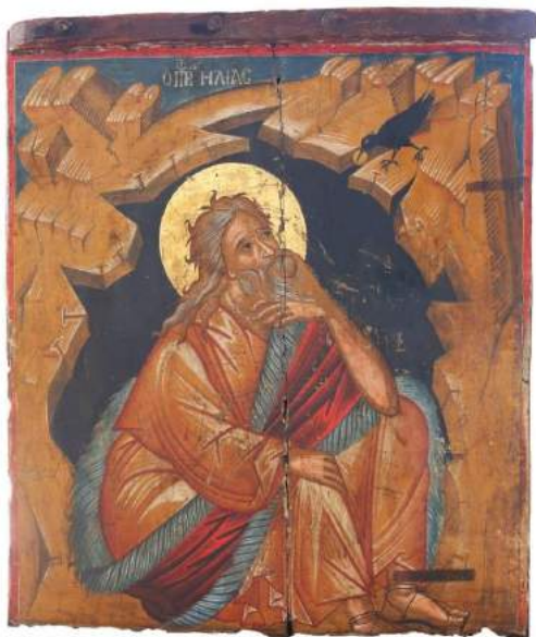
ΠΡΟΦΗΤΗΣ ΗΛΙΑΣ 16ος αιώνας ΠΕΓΓΕΙΑ, ΝΑΟΣ ΕΙΣΟΔΙΩΝ ΘΕΟΤΟΚΟΥ